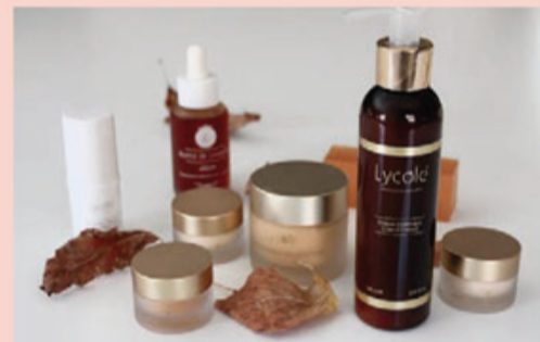
Gama de productos Lycolé